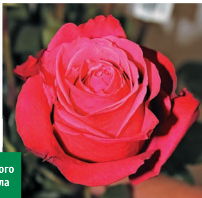
Роза 'Черри О' (' Cherry O ') изумительного малиново-красного оттенка притягивала внимание, как магнит. Букет из таких цветов – роскошный подарок к любому случаю. Этот сорт выращивают, главным образом, в Южной Америке (« S.I. Inverpalmass S.A.S. », Колумбия).