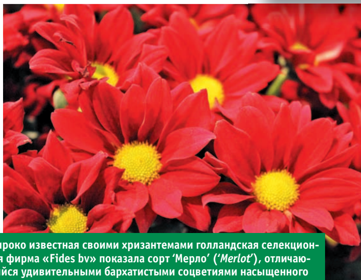
Широко известная своими хризантемами голландская селекционная фирма «Fides bv» показала сорт 'Мерло' ('Merlot'), отличающийся удивительными бархатистыми соцветиями насыщенного винно-красного колера с зеленовато-желтым центром и роскошной темно-зеленой листвой. Название сорту дано в честь знаменитого красного вина. Хризантема великолепно смотрится во флористических композициях.