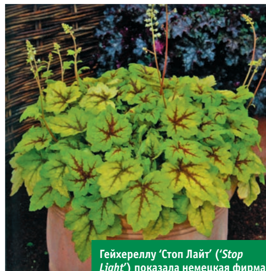
Гейхереллу 'Стоп Лайт' (' Stop Light ') показала немецкая фирма « Wolfschmidt Samen & Jungpflanzen GbR ». Благодаря светло-зеленым с темно-красными жилками листьям это растение прекрасно впишется в любой цветник.

Выставка «ЦветыЭкспо-2012» состоится 10–14 сентября 2012 г. Место проведения – Международный выставочный комплекс «Крокус Экспо» (Москва). Подробности – в ближайших номерах «Цветоводства».