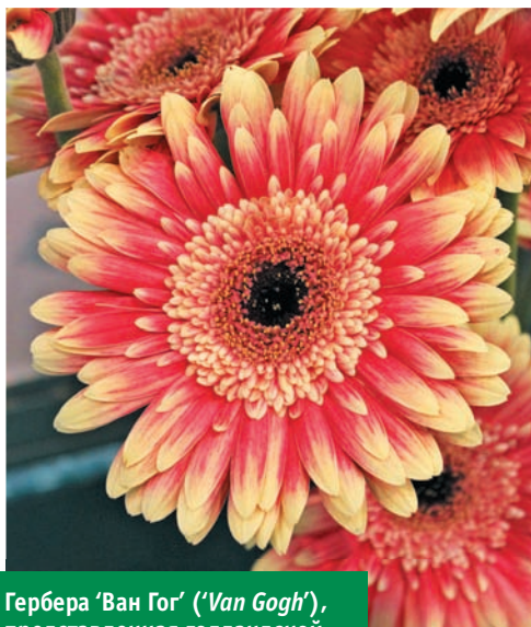
Гербера 'Ван Гог' (' Van Gogh '), представленная голландской фирмой « Hilverda De Boer », привлекала внимание необычной двуцветной кремово-розовой окраской и крупными соцветиями.

Выставка «ЦветыЭкспо-2012» состоится 10–14 сентября 2012 г. Место проведения – Международный выставочный комплекс «Крокус Экспо» (Москва). Подробности – в ближайших номерах «Цветоводства».