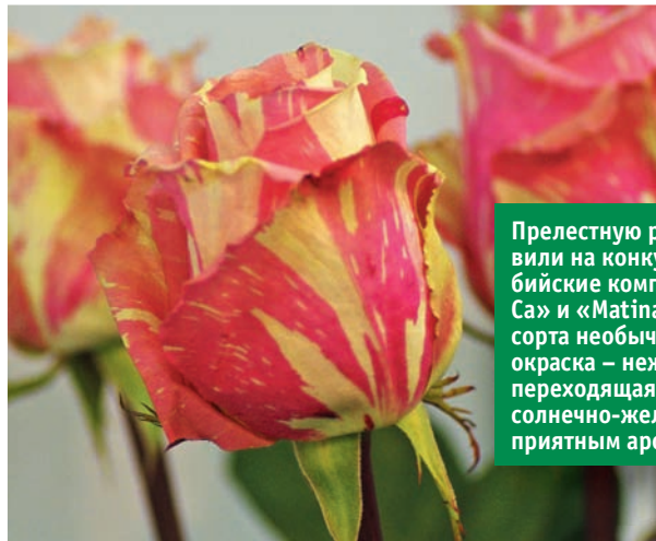
Прелестную розу 'Fiesta' представили на конкурс сразу две колумбийские компании – « Ci Vuelsen Sa » и « Matina Flowers ». У этого сорта необычная карамельная окраска – нежно-розовая, переходящая в молочно-белую и солнечно-желтую, – сочетается с приятным ароматом.