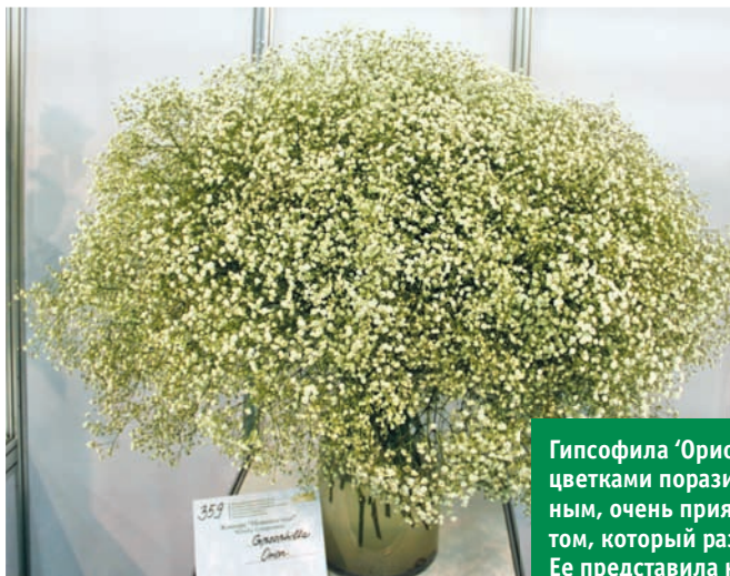
Гипсофила 'Орион' ('Orion') с крупными цветками поразила членов жюри сильным, очень приятным медовым ароматом, который разносился далеко вокруг. Ее представила на конкурс эквадорская фирма «Flor Eterna».

К большому сожалению среди них не оказалось культиваров, выведенных в нашей стране, но этому есть причины: до сих пор наша цветоводческая наука находится в жесточайшем кризисе, которому пока, увы, не видно конца.